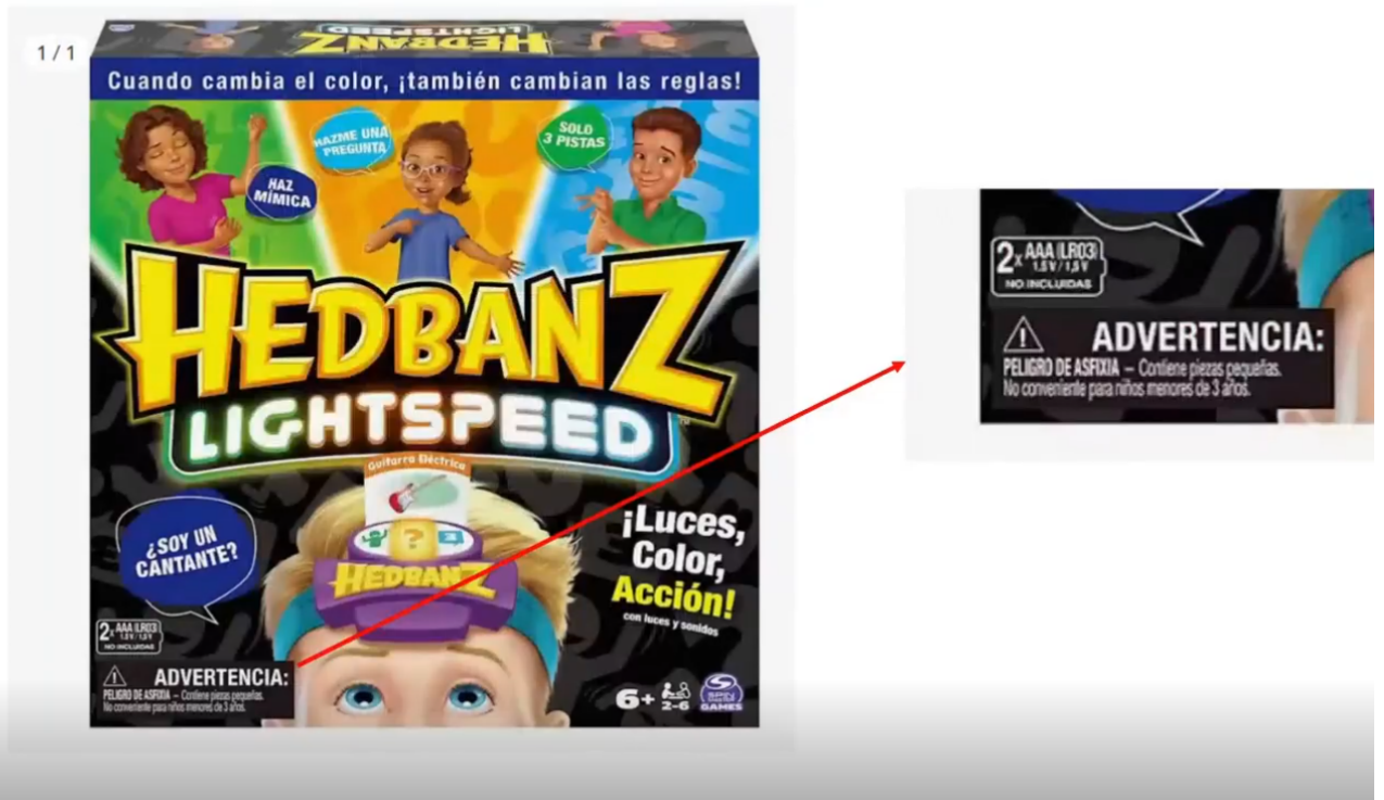
Imagen A3.05 - Ejemplo de advertencia de seguridad

Para registrar una advertencia de seguridad masiva , usaremos una regla nueva, con un filtro que dependerá de qué productos compartan la misma advertencia. Por ejemplo, si la comparten todos los productos de una misma categoría, de un mismo fabricante, etc.