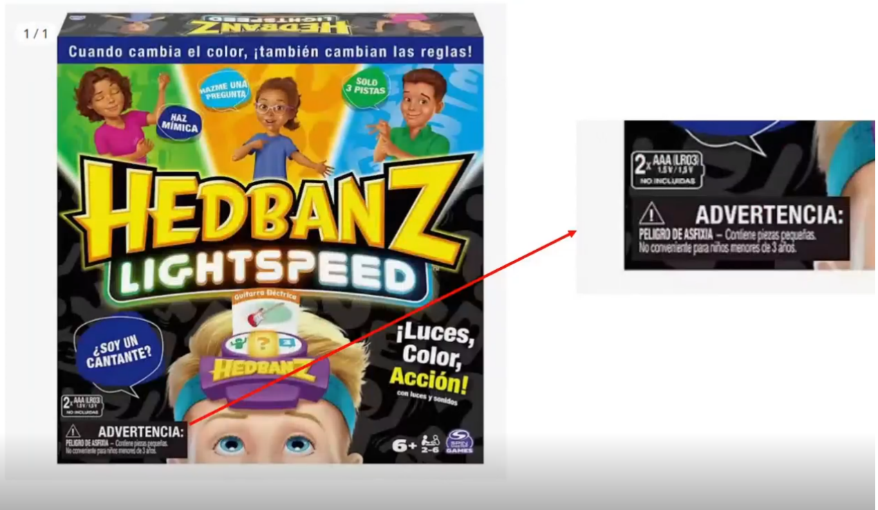
Imagen A3.05 - Ejemplo de advertencia de seguridad

Para registrar una advertencia de seguridad masiva , usaremos una regla nueva, con un filtro que dependerá de qué productos compartan la misma advertencia. Por ejemplo, si la comparten todos los productos de una misma categoría, de un mismo fabricante, etc.