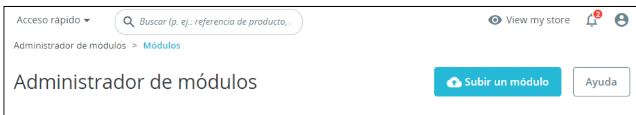
Imagen 2.02 - Botón “Subir un módulo” en el header del administrador de módulos

Hacer clic en el botón “ Subir un módulo ”. Arrastraremos o usaremos el explorador de archivos para seleccionar el módulo Miravia Connector, que debe estar comprimido en una carpeta (tendrá extensión .zip).